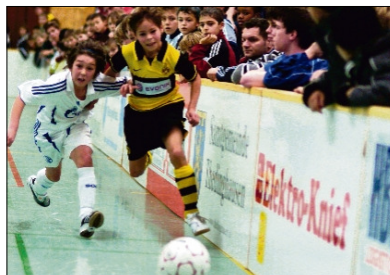
Packendes Finale: Schalke (links) gegen Dortmund.