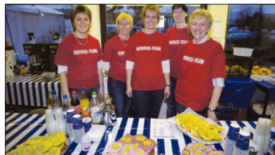
Ob Süßes oder Herzhaftes. Die MTV-„Feen“ hatten alles parat.