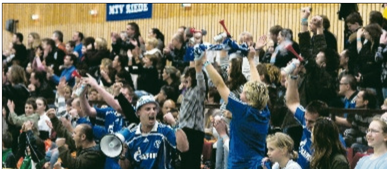
Die Bombenstimmung auf den Rängen: Eine der Zutaten, die den Reiz des Jugendförderkreis-Cups des MTV Riede ausmachen.