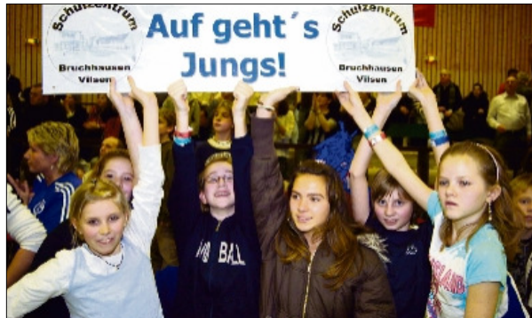
Zum besten Fanclub wurden die Anhänger der Überraschungsmannschaft des Schulzentrums Bruchhausen-Vilsen gewählt.