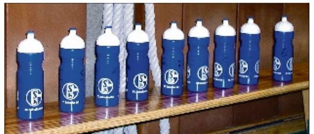
Nahezu profithaft war das Auftreten einiger Nachwuchs-Bundesligisten: Hier die Trinkflaschen-Parade von Schalke 04.