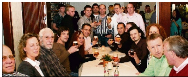
Die internationale Cup-Party im Gasthaus Schierloh in Felde bot ein leckeres Büfett und tolle Stimmung. Hier plauschen die Betreuer von Feyenoord Rotterdam, Rapid Wien, Borussia Mönchengladbach und Gastgeber Riede in Freundschaft miteinander.