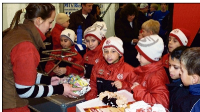
Dank guter Organisation: Den Jungkickern fehlte es an nichts.